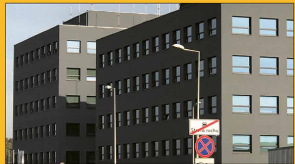
Budynki biurowe, ul. Wrocławska (przy C.H. Karolinka)