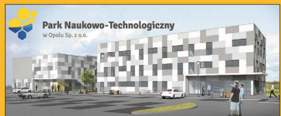
Park Naukowo-Technologiczny Opole, ul. Wrocławska obok CWK