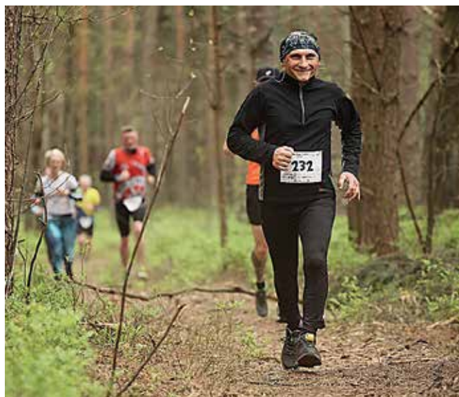
Piaszczyste pagórki były najbardziej wyczerpującą atrakcją „PagóRace”.

Każdy, kto ukończył bieg, dostał pamiątkowy medal. Osoby, które zajęły pierw-