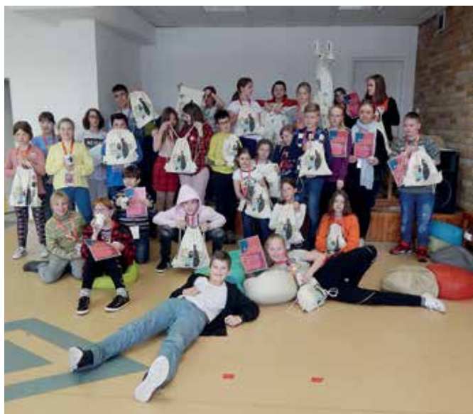
W warsztatach animacji poklatkowej udział wzięło 30 uczniów.