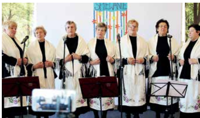
„Ligockie Wrzosi” z Ligoty Prószkowskiej

– Celem wydarzenia jest popularyzowanie piękno folkloru oraz lokalnych tradycji. To również chęć pokazania szerszej publiczności ważnego elementu naszego dziedzictwa, jakim są pieśni ludowe – mówi