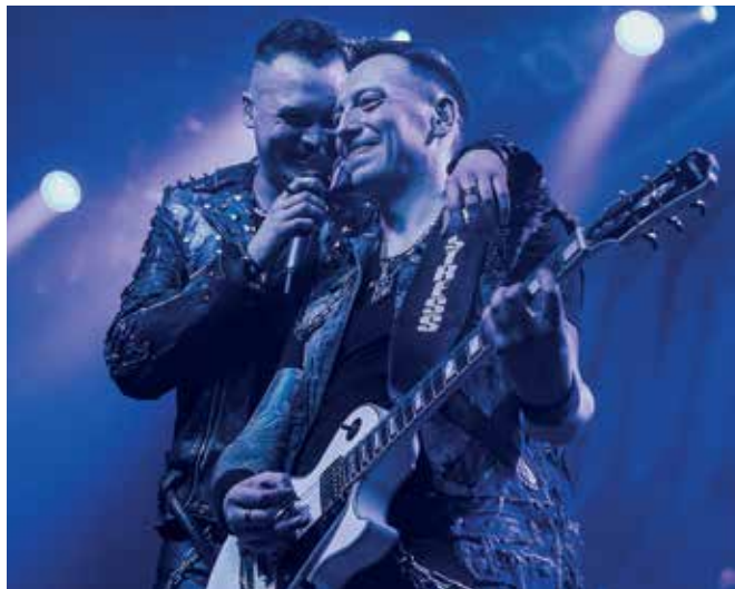
Nocny Kochanek wystąpi na kampusie UO 21 maja.

Następnie scenę przejmą zaproszone zespoły, które wykonają autorski program. Koncerty potrważą