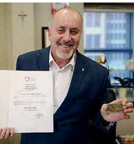
Henryk Lakwa, starosta opolski

Henryk Lakwa jest jedynym samorządowcem z naszego województwa uhonorowanym nagrodą Bene Meritus. Otrzymali ją premierzy, kilkunastu byłych i obecnych starostów z całej Polski, kilku szefów Związku Powiatów Polskich z ostatniego 20-lecia, a także prezydenci Gdyni, Sopotu i Gliwic.