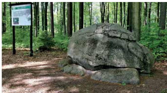
Diabelski Kamień w Lipnie