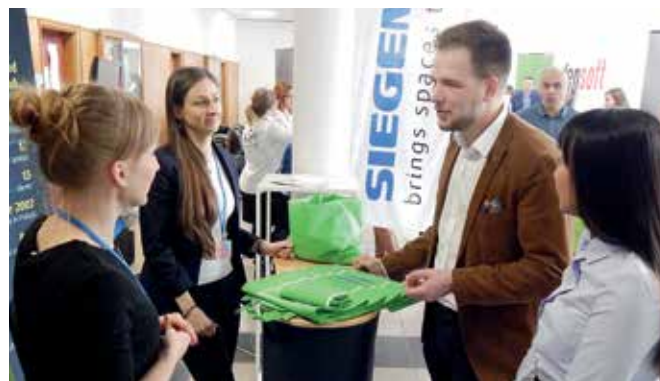
Pracodawcy przekonywali młodzież o zaletach praktyk studenckich.

Impreza, która odbyła się 12 kwietnia w siedzibie UO