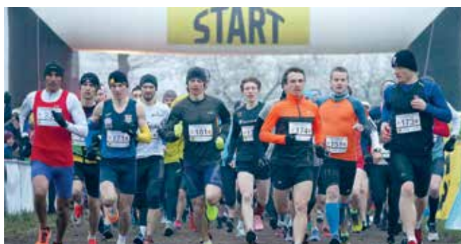
W Prószkowie pobiegli Polacy, Ukraińcy i Marokańczyk.

Bieg rozpoczął się i zakończył na stadionie miejskim. Uczestnicy imprezy przebiegli ulicami Prószkowa 10 kilometrów.