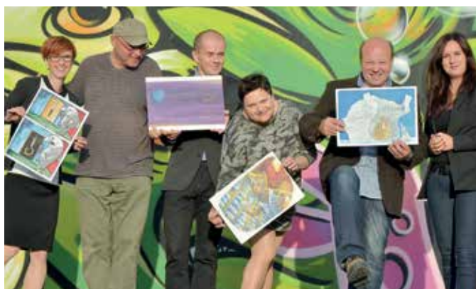
Jury konkursu „Mały Karpik” w 2018 roku ze zwycięskimi pracami.

Przede wszystkim jest ciepło, nie kapie, nie wieje, nie zacieka! Ten obiekt został oddany do użytku w 1974 roku. W zeszłym roku dokonaliśmy jego termomodernizacji, została wymieniona