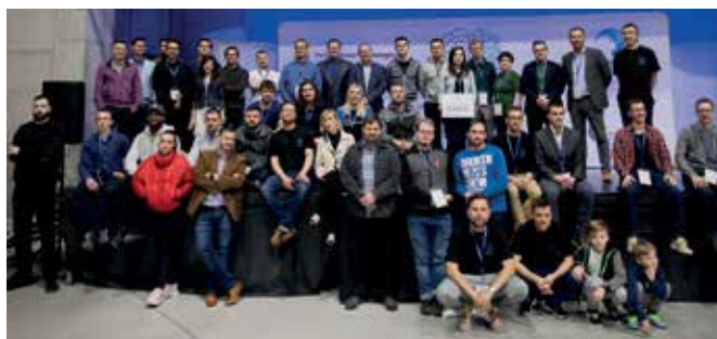
W maratonie zmierzyło się 70 miłośników programowania.

Przez blisko dobę uczestnicy zmagali się z zadaniem