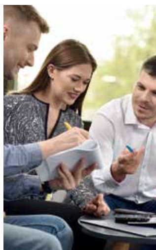
Bezpłatne warsztaty w WSB potrwać do 11 czerwca.