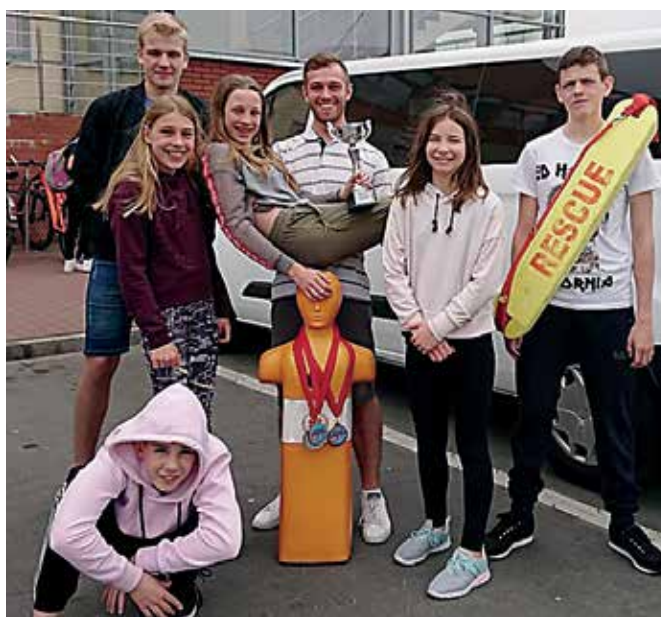
Drużyna Ratownictwa Wodnego Rzeczypospolitej