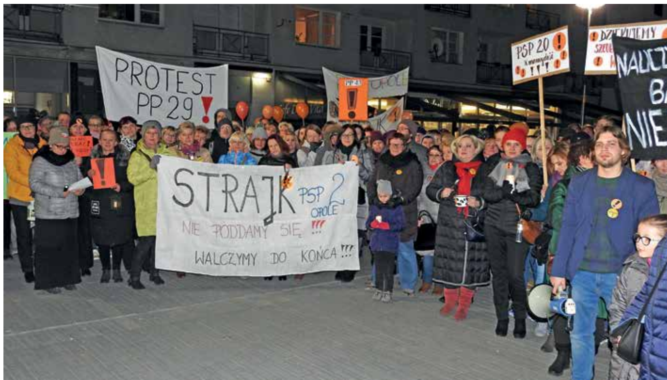
Na pl. Wolności w Opolu podczas strajku przychodzili nauczyciele, młodzież i rodzice – wszyscy popierający protest.