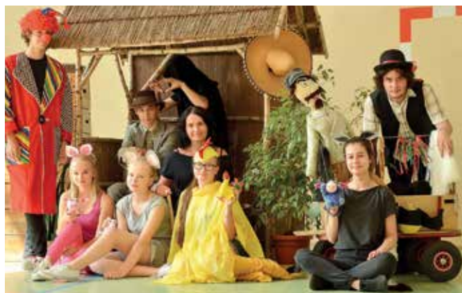
Młodzieżowa grupa teatralna.

Konkurs faktycznie stale się rozwija, poziom wokal-