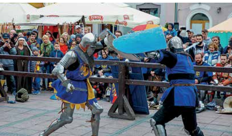
Jarmark średniowieczny przy murach obronnych potrwa od 10 do 22 w sobotę 18 maja.