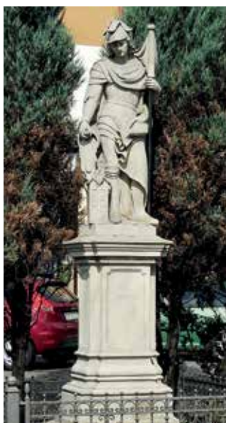
Rzeźba św. Floriana na Rynku w Niemodlinie