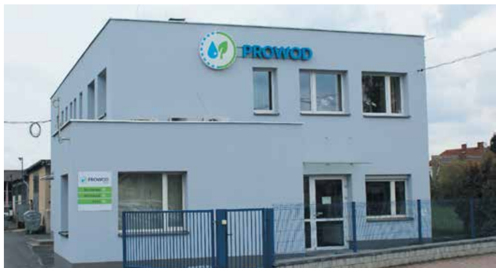
Zmodernizowane biuro Prowod Sp. z o.o. w Opolu-Czarnowasach

Po połączeniu PROWOD Sp. z o.o. to jednostka, która wykonuje bardzo szeroki wachlarz usług z zakresu zadań własnych gmin. Jej głównym zadaniem jest zaopatrywanie miesz-