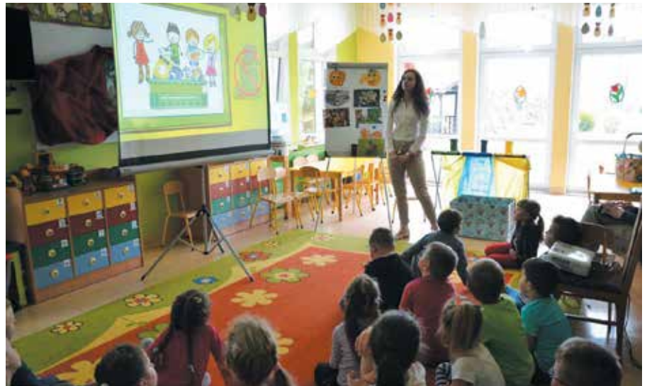
Prelekcja o dbaniu o środowisko poprzez segregację odpadów, oszczędność wody i prądu

Prowod Sp. z o.o. to organizacja, która zawsze jest na dyżurze. Musimy reagować stale na awarie, wahania procesów technologicznych, ale także czerpać z nowoczesnych rozwiązań pojawiających się w naszej branży. Stąd pełnimy rolę nie tylko wykonawcy, inspektora nadzoru, ale również inwestora. Stale rozbudowujemy i modernizujemy posiadaną infrastrukturę. W ostatnich latach spółka zrealizowała oraz brała czynny udział w wielu kluczowych inwestycjach, m.in. modernizacji oczyszczalni ścieków w Czarnowasach, modernizacji Stacji