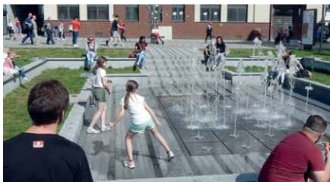
Efektowne pokazy fontanny z muzyką rozpoczynają się o godz. 12, 15, 19, 20 i 21.