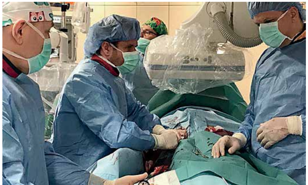
Metoda mało inwazyjna polega na wszczepieniu zastawki przez tętnicę udową.

– Sama metoda polega na wszczepieniu zastawki bez otwierania klatki piersiowej, czyli tzw. metodą TAVI. Wykonaliśmy już ponad 100 takich zabiegów przez ostatnie kilka lat z dobrymi wynikami, natomiast teraz