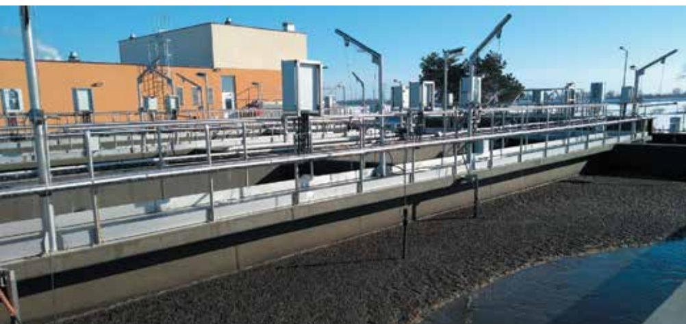
Nowa oczyszczalnia ścieków w Dobrzeniu Wielkim

Podsumowując, ostatnie 25 lat działalności gospodarczej spółki to czas, który został wykorzystany do zwiększenia potencjału gospodarczego i stabilizacji ekonomicznej, a także wdrożenia wielu nowoczesnych rozwiązań teleinformatycznych. Dziękujemy Właścicielom, Radzie Nadzorczej, Partnerom Biznesowym, a także byłym i obecnym Pracownikom za dobrą i owocną współpracę. Jednak najbardziej chcielibyśmy podziękować Mieszkańcom Gmin, które obsługujemy, ponieważ to dzięki Państwu możemy dziś świętować ten piękny jubileusz.