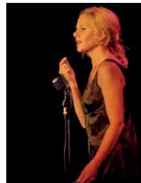
Fot. EkoStudio Zebrała AK

Kameralny teatr przy ul. Armii Krajowej 4 zaprasza 18 maja (sobota) na przedstawienie „Takie małe nic” (godz. 19.07). To propozycja na wieczór z piosenkami Hanki Ordonówny, w wykonaniu Judyty Paradzińskiej, w reżyserii Andrzeja Czernika.