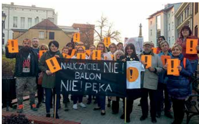
Nauczyciele akademicy i studenci Uniwersytetu Opolskiego poparli protest nauczycieli.

tywacji – jaka płaca, taka praca. Ot, dictum acerbum.