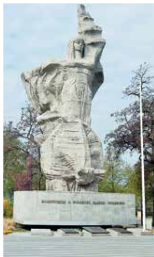
Pamiątkowa tablica zostanie wmurowana przed opolską Nike.

Pomysłem na upamiętnienie 30. rocznicy wolnych wyborów jest też nadzwyczajna sesja rady miasta zaplanowana na niedzielę 2 czerwca, któ-