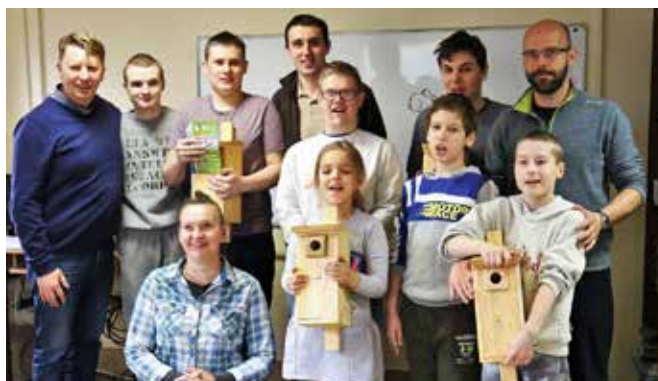
Dzieci z autyzmem z niewielką pomocą opiekunów zmontowały cztery domki dla ptaków.

P odczas zajęć technicznych, które odbyły się w Zespole Szkolno-Przedszkolnym w Kup, dzieci miały okazję wysłuchać również wykładu Michała Stelmaszyka, zastępcy dyrektora Zespołu Opolskich Parków Krajobrazowych.