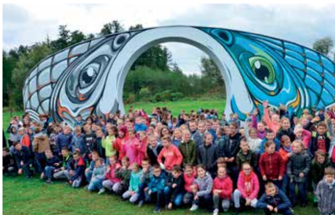
Uczniowie na tle rybnego muralu, który powstał na ścianie dawnego amfiteatru przy OK.

stolarka okienna i drzwiowa, przebudowana kotłownia, uruchomiona wentylacja, obiekt został dostosowany dla osób niepełnosprawnych, wyremontowaliśmy toalety, salę konferencyjną, hol, foyer, wyposażyliśmy obiekt w system sygnalizacji pożaru, podświetliliśmy fasadę główną.