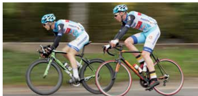
Kolarze ścigali się ulicami Dębia, Dańca i Dębskiej Kuźni.

– Nasz mistrz zaczynał tutaj jeszcze jako uczeń. Oczywiście nie wygrywał od razu, ale za to zajmował wysokie miejsca. W końcu zapisał się do mojego klubu, po-