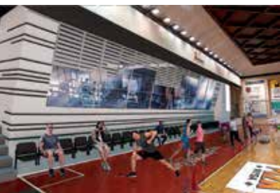
Wizualizacja hali gimnastycznej po remoncie