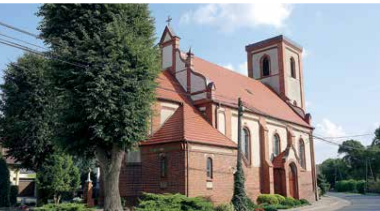
Kościół św. Floriana w Naroku