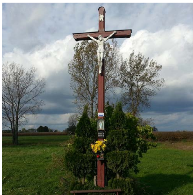
Krzyż na polu Gruntów – Żłinice, droga nad Odrą

Nołbardzi pokryncónoł, moym zdaniym, historia moł krzyż na polu od Gruntów. Je łón łogrómnie wielki. Z tego, co zech sie docytoł na niym, łostoł łón postawióny w 1909 roku przez mieszkańców gminy. Powodym tego, że go postawili bóła tragicznoł śmierć modego rolnika, ale nie je to jedyny powód. Podobno ludzie widywali tam chodzónce po łónce na bioło łoblecóne dziółchy. Przez to na te pole ludzie gołdajóm niby „Pani łónka”. Ale gołdało sie też ło chopie, który z roboty wrołcoł i w pobliżu tego krzyza wskocóło mu cojś na plecy. Zdołwało mu sie to coróž ciynższe, ale nie umioł się łobrócić, coby łobejrzeć co za pieróństwo mu na plecach siedzi. Przii nastympnym mostku zeskokóło, śmiejónc sie łokropnie. A jeszcze jedna historia dopedzioł nó m kolega z roboty łod ołpy. Pedzioł łón, że o północy w Wielki Pióntek w tamtym miejscu tańcowały chopi. Wiela w tym je prołdy, to joł nie wiam, ale skuliś tego miyndzy innymi postawili tam tyn krzyż.