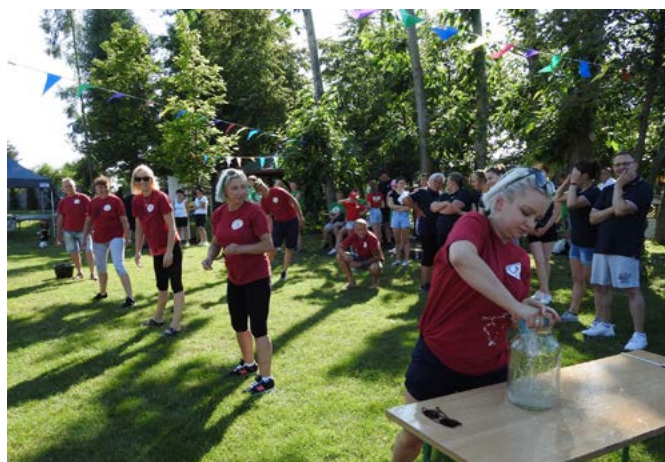
„Latające gąbki” to konkurencja, która otworzyła sołeckie zmagania o prym w gminie Dobrzeń Wielki.