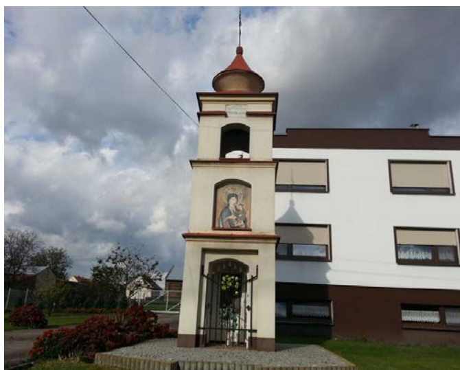
„Dzwónnica” – Żłinice, ul. Jędrzejczyka