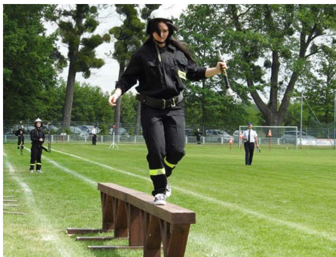
Wszystkie drużyny walczyły o Puchar Wójta Gminy Dobrzeń Wielki.

Dobrzeń Wielki zostały zorganizowane przez OSP Chrościce oraz gminę Dobrzeń Wielki. Wydarzenie finansował Marszałkowski Budżet Obywatelski.