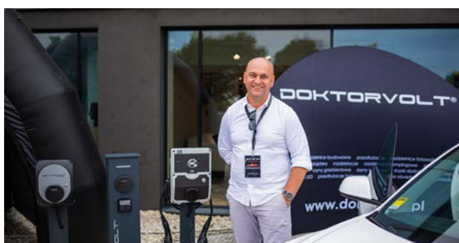
Wydarzenie zorganizowały galeria wnętrz Dobroteka, firma Doktorvolt i Opolskie Centrum Rozwoju Gospodarki.