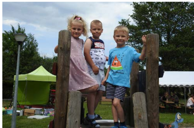
Festyn rodzinny został zorganizowany przez sołtyskę i radę sołecką miejscowości Lubienia.

I właśnie tuż po godz. 19.00 na placu przy świetlicy wiejskiej w Lubieni rozpoczęła się zabawa przy muzyce. MS