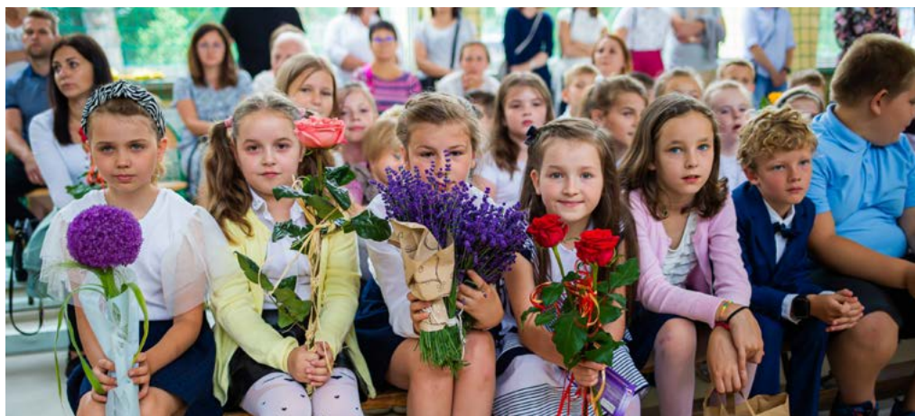
Zakończenie roku szkolnego w Zespole Szkolno-Przedszkolnym w Pokoju.