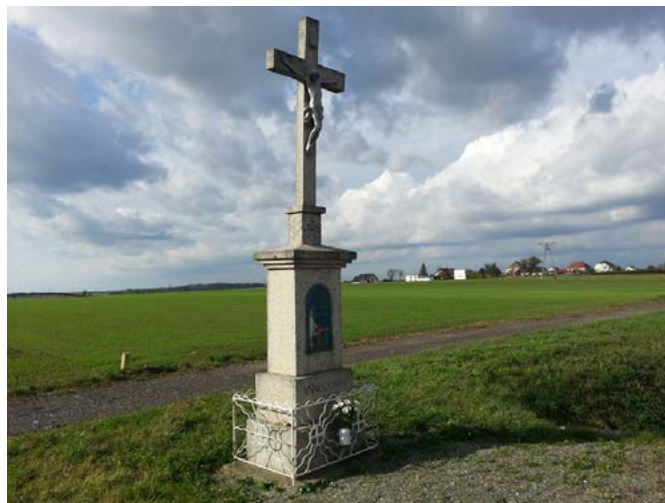
Krzyż Chudalów – Żłinice, ul. Krapkowicka