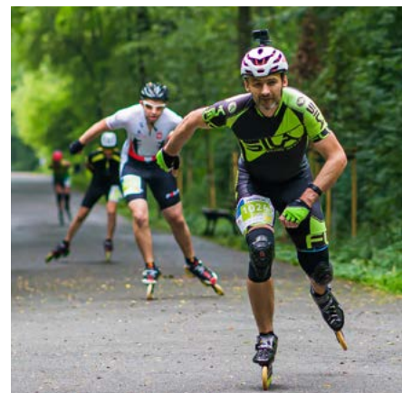
Na wyspie Bolko rywalizowali również rolkarze.

Poza samymi startami na uczestników wydarzenia czekało też dużo pobocznych atrakcji. Imprezę zorganizowało stowarzyszenie Bieg Opolski.