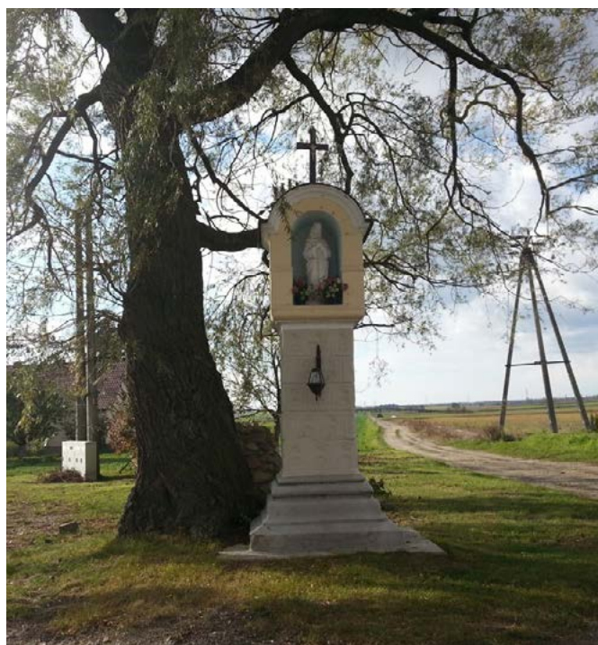
Kapliczka Małozska – Żłinice, ul. Prószkowska

Kapliczka Małozska bóła drugoł w kolejności. Małozek wybudowoł jóm ku pamiynci swoich dwóch synów, ktorzi to polegli we wojnach światowych. We wnyncce stoi figurka Niepokalanej. Zaniym ta kapliczka powstała, stoł tam w tym samym placu sup z łobrazym św. Izidora.