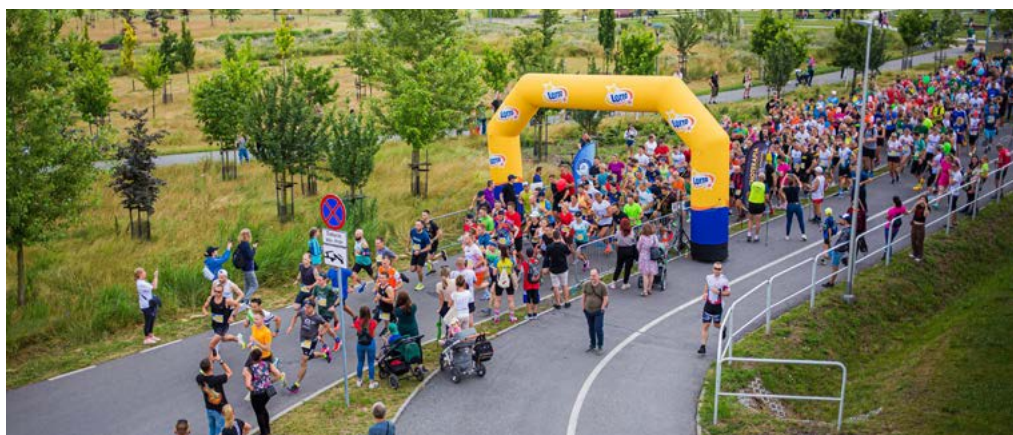
Starty rozpoczęły się i kończyły w parku 800-lecia Opola na wyspie Bolko.