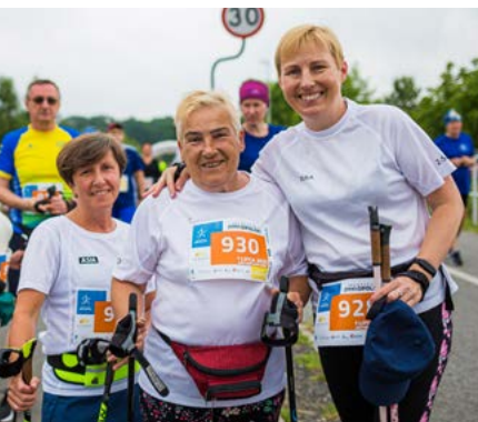
Zaraz po biegaczach na trasę wyruszyli sympatycy nordic walking.

Wszystkie starty rozpoczęły się i kończyły w parku 800-lecia Opola. Jako pierwsze pobiegły na 100 m dzieci do 7. roku życia. Kolejne były kategorie: 7–8 lat (250 m), 9–10 lat (400 m), 11–12