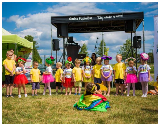
Wśród atrakcji otwarcia sezonu letniego na siołkowskim kąpielisku znalazły się występy dzieci.