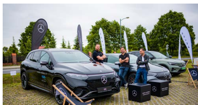
Impreza odbyła się pod galerią wnętrz Dobroteka w Dobrodzieniu.