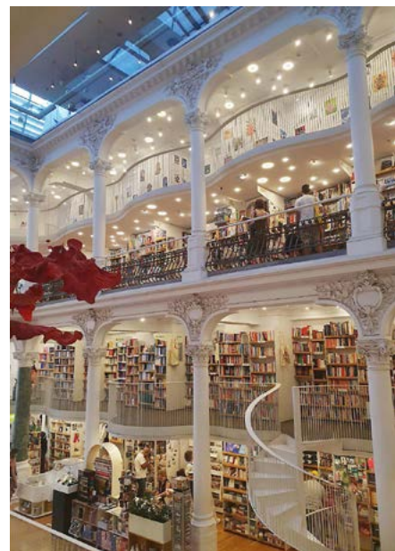
W Bukareszcie Zofia odwiedziła między innymi dużą księgarnię „Cărturești Carusel”.