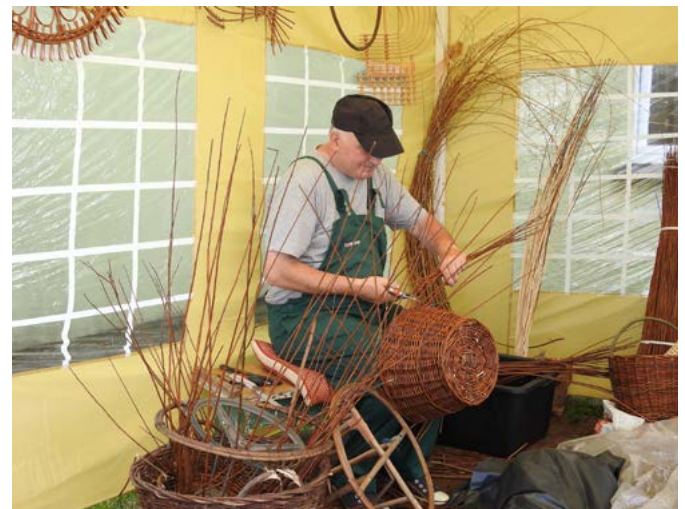
Wyroby z wikliny nadały charakteru całemu wydarzeniu.

Wydarzenie współfinansowane było ze środków samorządu województwa opolskiego w ramach zadania „800 lat Starych Siołkowic – z przeszłości w przyszłość Opolszczyzny”.