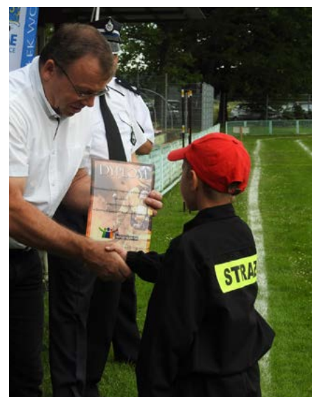
Na wydarzeniu obecny był wójt gminy Dobrzeń Wielki Piotr Szłapa.