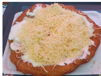
Wśród specjalności, których spróbowała mieszkanka Murowa, był węgierski placek langosz.

Tak. Bułgaria i Rumunia leżą w Unii Europejskiej, ale nie w strefie Schengen, dlatego też na przejściach granicznych przechodziłam kontrole paszportowe. Podróż z Bukaresztu do węgierskiego Budapesztu trwała 15 godzin. Jechałam pociągiem, śpiąc w kuszetce, w dość komfortowych warunkach, jak w kołysce. Minusem była jednak wspomniana kontrola, która wypadła około godziny 4.00.