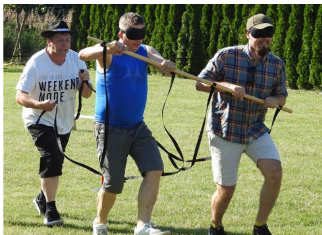
Tego dnia liczyła się przede wszystkim integracja i dobra zabawa.

Impreza została zorganizowana przez: sołectwo Dobrzeń Mały, OSP Dobrzeń Mały oraz Gminne Zrzeszenie LZS. Wydarzenie finansowano w ramach Marszałkowskiego Budżetu Obywatelskiego.