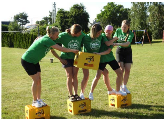
W rywalizacjach wzięło udział 5 sołectw.