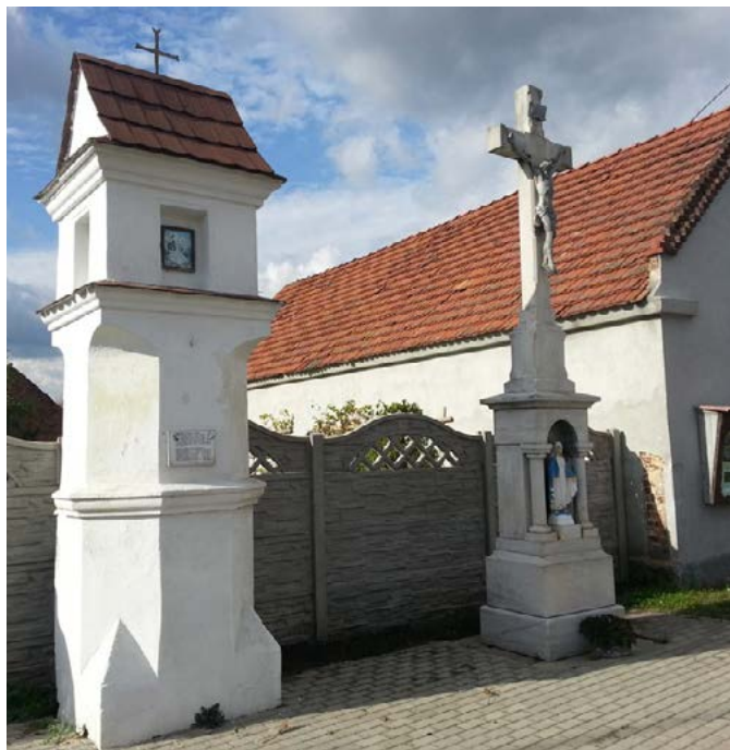
Kapliczka i krzyż Klucznych – Żłinice, ul. Krapkowicka