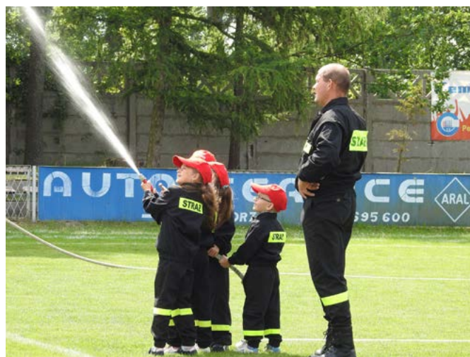
Liczyła się nie tyle rywalizacja, co dobra zabawa.