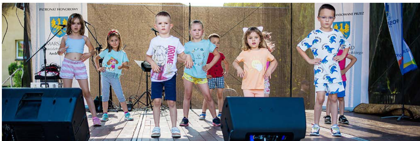
W programie wydarzenia znalazły się między innymi występy taneczne.