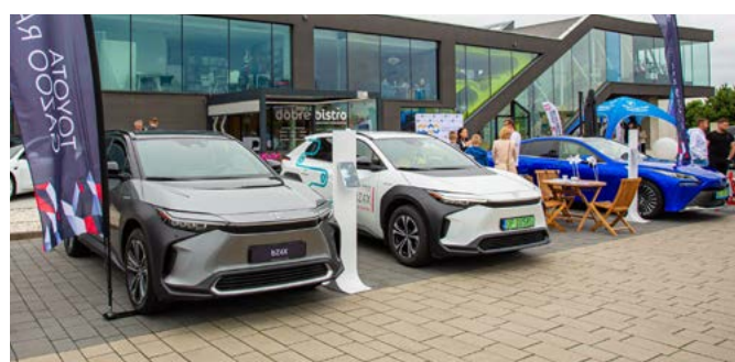
Uczestnicy Electro Moto Show mogli podziwiać około dwudziestu modeli samochodów.

Imprezę Electro Moto Show zorganizowały: galeria wnętrz Dobroteka, firma Doktorvolt oraz Opolskie Centrum Rozwoju Gospodarki. Wszystko to we współpracy z Polskim Związkiem Motorowym z Opola i Opolską Izbą Gospodarczą.