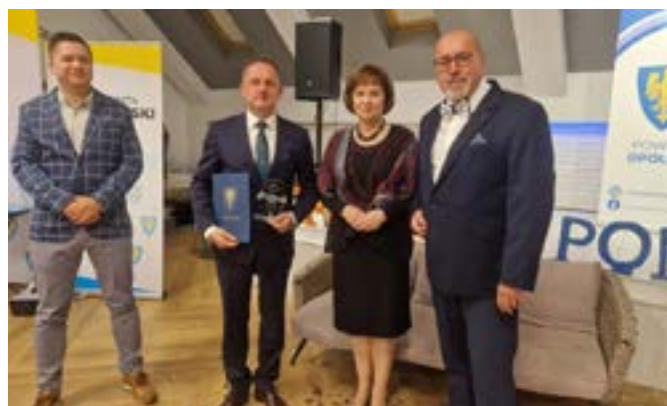
Podczas uroczystości wręczono Nagrody Starosty Opolskiego.

Komendanci Komendy Miejskiej Państwowej Straży Pożarnej w Opolu i Komen-