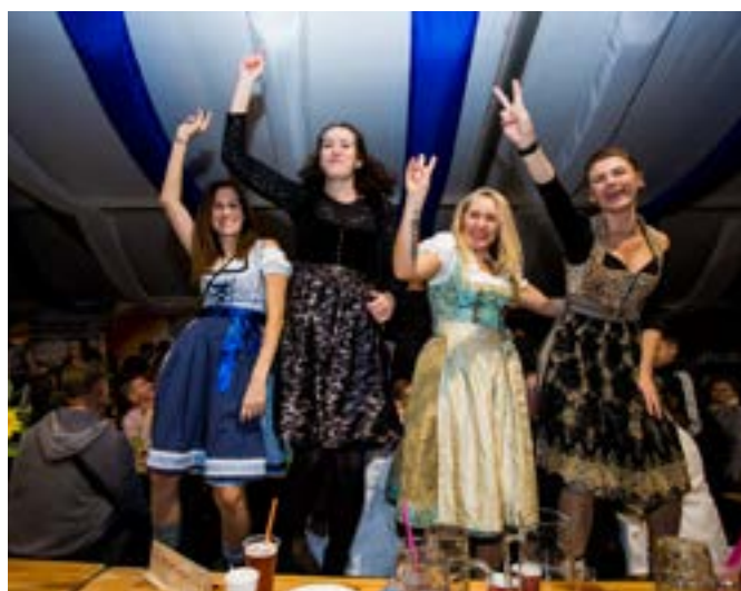
Tańczyć można wszędzie – nawet na ławach.