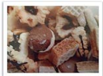
Pieczenie ciasteczek (2021 r.); źródło: ze zbiorów własnych

Od kilunastu löt jeżdżymy róż do roku razem na wycieczka. Przeważnie sòm óne cztyrodniowe. Wtedy je czas na wspólne zwiydzanie, biesiadowanie, wspõmina-