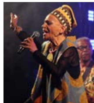
Mfa Kera zabrała uczestników w podróż do afrykańskich korzeni bluesa i jazzu.

Festiwal z roku na rok cieszy się coraz większym zainteresowaniem. Już drugi raz ma charakter międzynarodowy, co świadczy o tym, że organizatorzy stawiają na rozwój i poszerzanie muzycznych horyzontów.