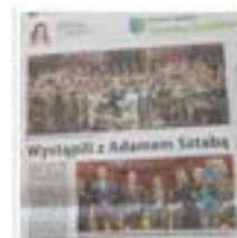
„Strzelec Opolski” (lipiec, 2024 r.)