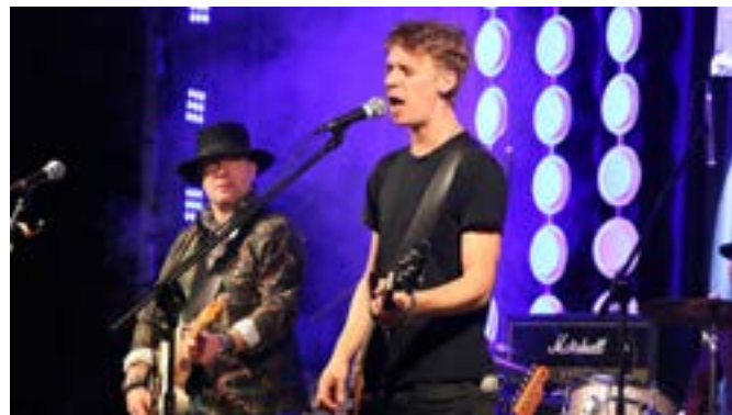
Miłośnicy klasycznego rocka mogli posłuchać występu zespołu Runkee.