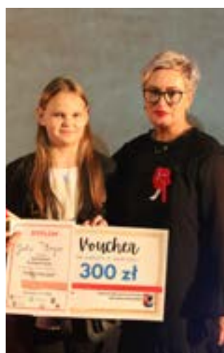
Laureatka Nagrody Burmistrza wraz z Organizatorką konkursu

Wszystkim laureatom serdecznie gratulujemy!