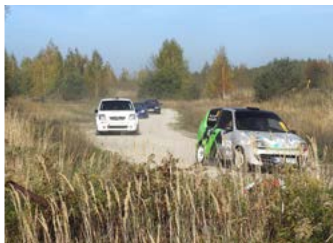
Kierowcy musieli wykazać się sprawną jazdą po nawierzchni szutrowej.

– Do trzeciej rundy Kierowcy Roku Opolszczyzny zgłosiły się 24 żałogi i jak na nawierzchnię szutrową jest to całkiem przyzwoity wynik. Myślę, że organizatorzy są mile zaskoczeni i zadowoleni