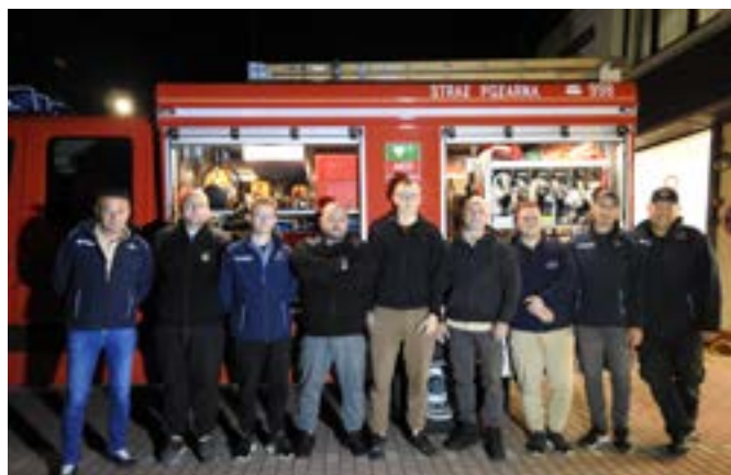
Jednostka OSP Czarnowąsy istnieje już od 121 lat.

OSP Czarnowąsy liczy obecnie 37 czynnych strażaków i 24 wspierających, a pięciu przygo-