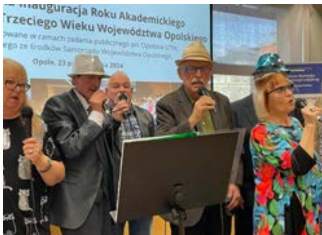
Inaugurację roku uświetniły występy artystyczne.

– Uniwersytety trzeciego wieku są niezwykle popularne. Gromadzą najaktywniejszych, najbardziej ciekawych świata, najbardziej chętnych do tego, żeby ze sobą być. Wspieramy te oddolne społeczne inicjatywy niezwykle istotne dla środowiska senioralnego. Chcielibyśmy, by