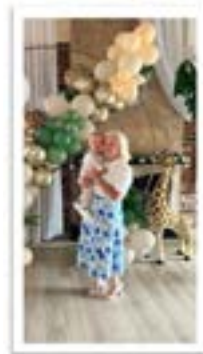
Ja z wnuczkiem (2023 r. i 2024 r.)