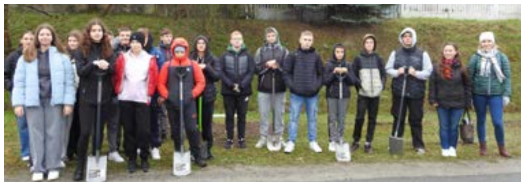
Uczniowie PSP w Chróścicach jako pierwsi posadzili drzewa w ramach projektu Eko Gmina – Edukacja, Motywacja, Działanie.