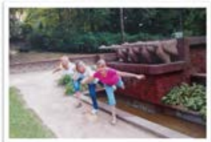
nie, a i powygupianie. Wycieczka - Szczecin, Międzyzdroje, Świnoujście (2014 r.); źródło: ze zbiorów własnych

Od kilunastu löt jeżdżymy róż do roku razem na wycieczka. Przeważnie sòm óne cztyrodniowe. Wtedy je czas na wspólne zwiydzanie, biesiadowanie, wspõmina-