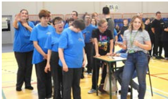
Igrzyska bez Barier odbyły się w Turawie po raz 21.

Wojewódzkie Zrzeszenie Ludowe Zespołów Sportowych w Opolu.