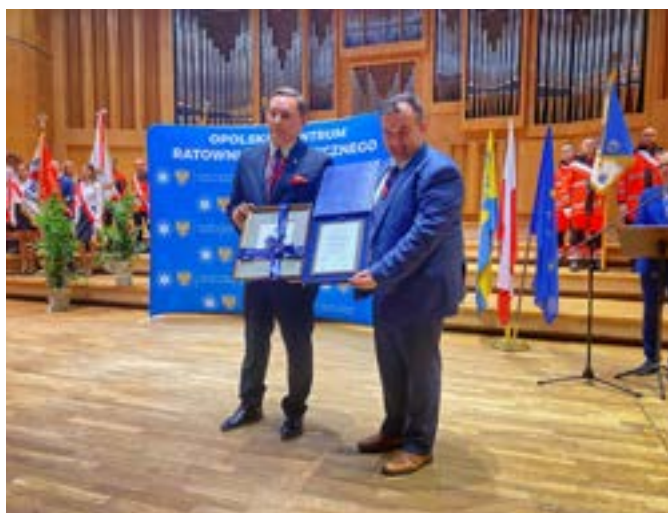
Podczas uroczystości wręczono dyplomy i podziękowania dla pracowników służby zdrowia.