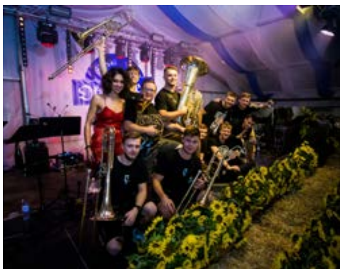
Do zabawy zachęcała muzyka m.in. zespołu Fest Kapellä.