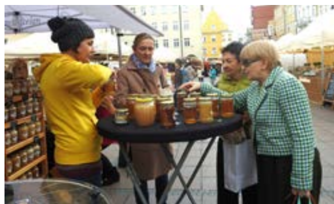
Na Festiwalu Czekolady i Słodkości każdy mógł znaleźć coś dla siebie.