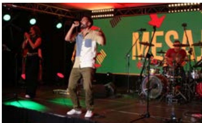
Mesajah występujący na scenie Studenckiego Centrum Kultury w Opolu

Każdy prezentował utwór własny i konkursowy z reper-