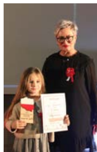
Laureatka II miejsca wraz z Organizatorką konkursu.