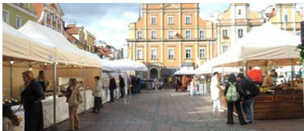
Czekały stoiska ze słodyczkami, kawą, ciastami, deserami i kuchnią świata.

– U nas można spróbować przepysznej czekolady, którą sami robimy. Dodatkowo mamy gorącą jesienną herbatę z nutą pomarańczy i laską cynamonu. Do tego megażele, żelki na wagę, owoce w czekoladzie oraz orzechy w karmelu, miodzie i czeko-