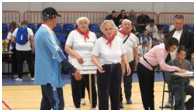
Osoby z niepełnosprawnościami rywalizowały w różnorodnych konkurencjach.

– Włączając osoby z niepełnosprawnościami do codziennego życia, mamy na celu pokazywać, że żyją one tak samo, mają te same pra-