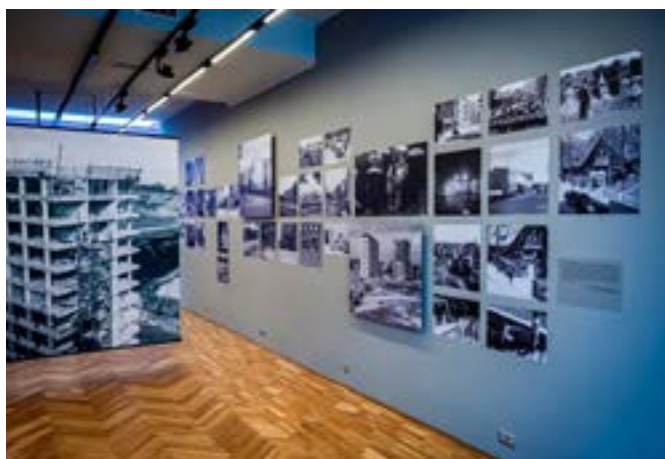
Wystawie towarzyszy katalog (dostępny w kasie MŚO).

S tanisław Bober (1908-1990) zajmuje ważne miejsce w gronie artystów działających w Opolu po drugiej wojnie światowej. Był malarzem, grafikiem, projektantem, nauczycielem i jedną z czołowych postaci lokalnego środowiska fotograficznego. W 1946 roku współtworzył Stowarzyszenie Miłośników Fotografiki w Opolu, był człon-