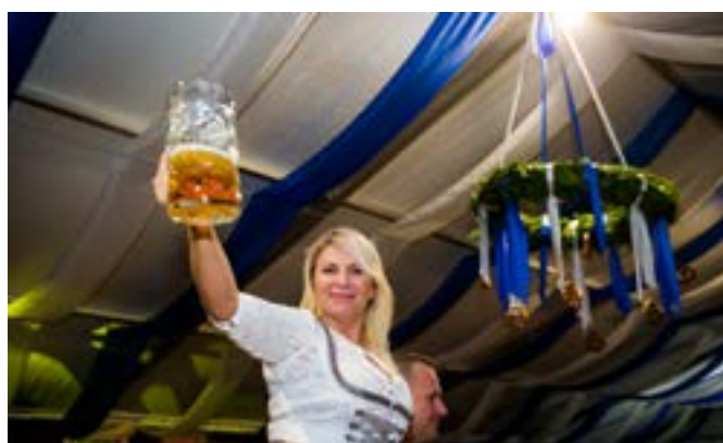
Na Śląskim Oktoberfeście nie mogło zabraknąć bawarskich strojów i złotego trunku.