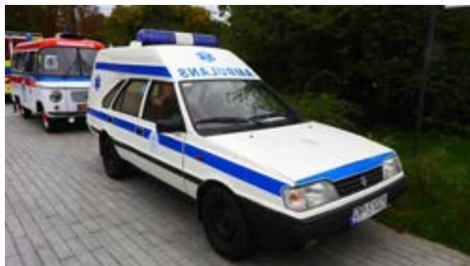
Nie zabrakło też pojazdów medycznych z dawnych czasów.

Spotykamy ich wszędzie tam, gdzie zagrożone jest życie i zdrowie ludzkie, gdzie zdarzy się wypadek, katastrofa czy klęska żywiołowa. Ich rola w systemie opieki zdrowotnej jest nieoceniona. Ogólnopolski Dzień Ratownictwa Medycznego to okazja do podziękowań i wręczenia odznaczeń osobom zasłużonym dla ratownictwa medycznego.