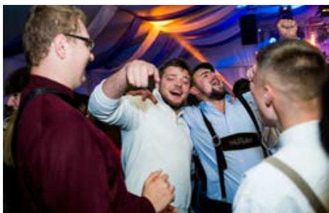
Szampański nastrój zdecydowanie dopisywał.