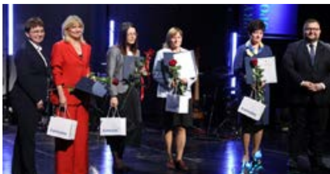
Przyznano nagrody nauczycielom i uczniom.

Wśród laureatów spotkaliśmy nauczycielkę dorosłych, która właśnie przeszła na emeryturę i Nagroda Marszałka jest dla niej satysfakcjonującym zwieńczeniem