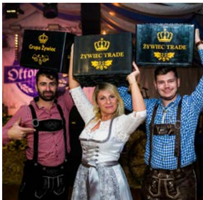
Krattenwals wymaga nieco siły, ale jak widać, uczestnikom Śląskiego Oktoberfestu jej nie brakuje.