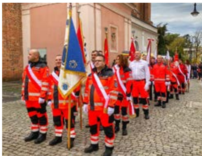
Wszyscy zaproszeni goście przemaszerowali ulicami Opola.