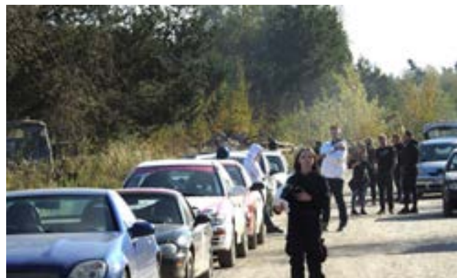
Sędziowie monitorowali przebieg zawodów, dbając o bezpieczeństwo wszystkich uczestników.

Portal i miesięcznik Opowiecie.info objął to wydarzenie patronatem medialnym.