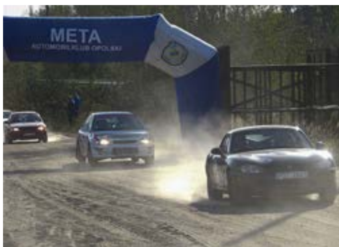
Żałogi zmierzyły się z dwiema próbami sprawnościowymi – PS Szutry OSP i PS Szutry Żwirownia.