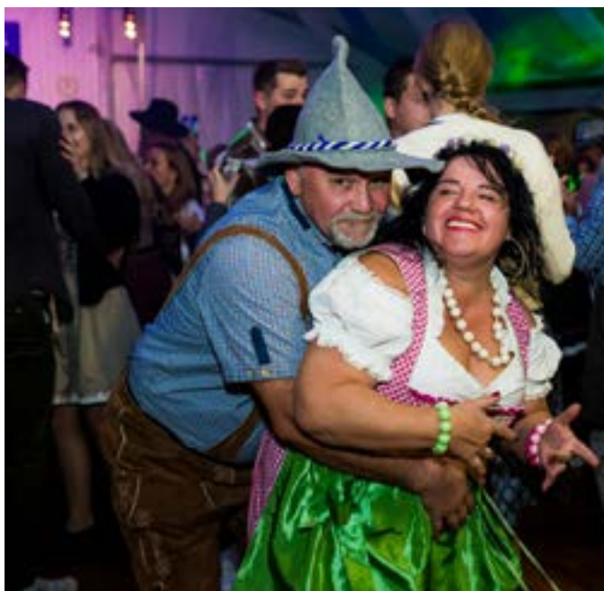
Kolorowe stroje, muzyka i wspaniała atmosfera – tak w skrócie można opisać szósty Śląski Oktoberfest w Dobrzemiu Małym.