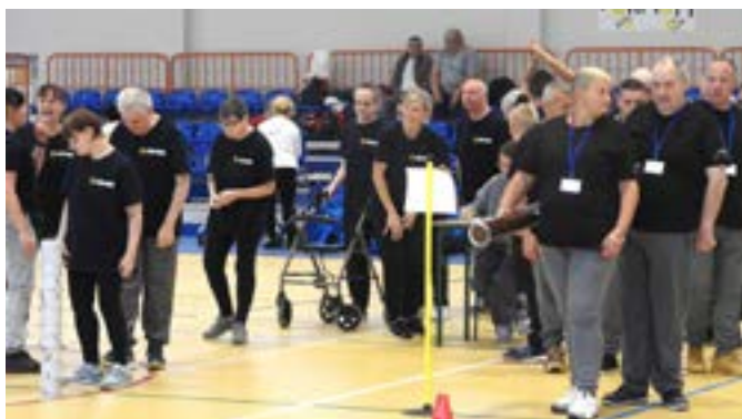
Konkurencje nawiązywały do jezior i lasów, charakterystycznych dla gminy Turawa.