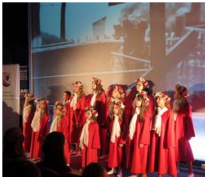
Występ zespołu "AKCES" na VII Festiwalu "Tobie Polsko"