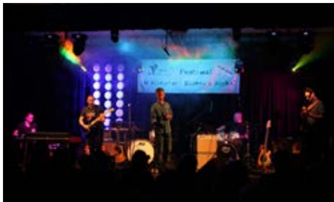
Zespół Day Off wystąpił na festiwalu już po raz trzynasty.