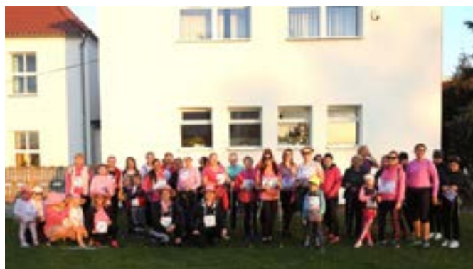
Różowy bieg promował świadomość na temat chorób nowotworowych kobiet.

Klimat wydarzenia stworzyły różowe stroje i pla-