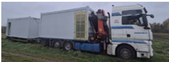
Domy są wyposażone między innymi w kuchenki i lodówki.